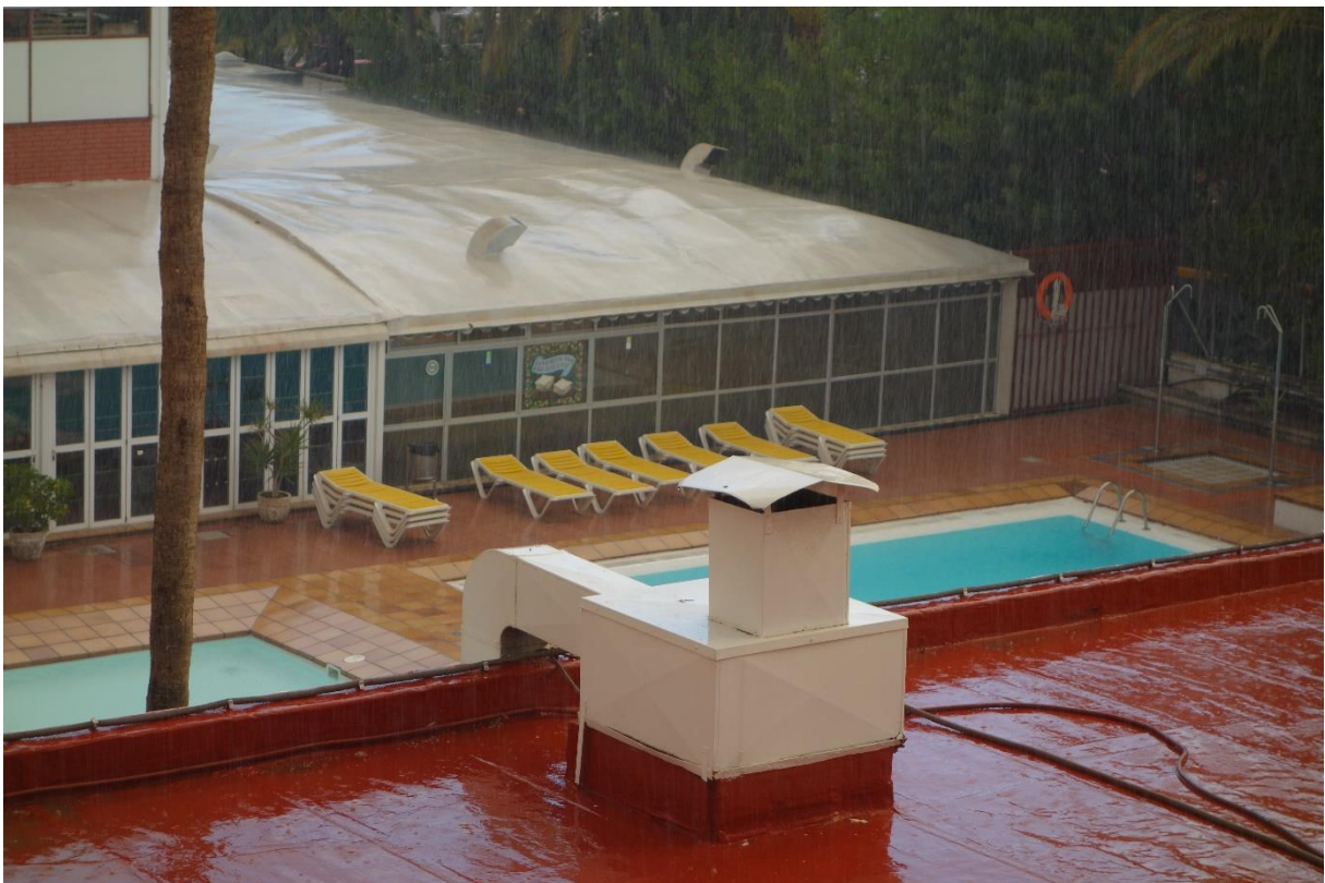
... og dermed får vi noen dråper med regn igjen ...