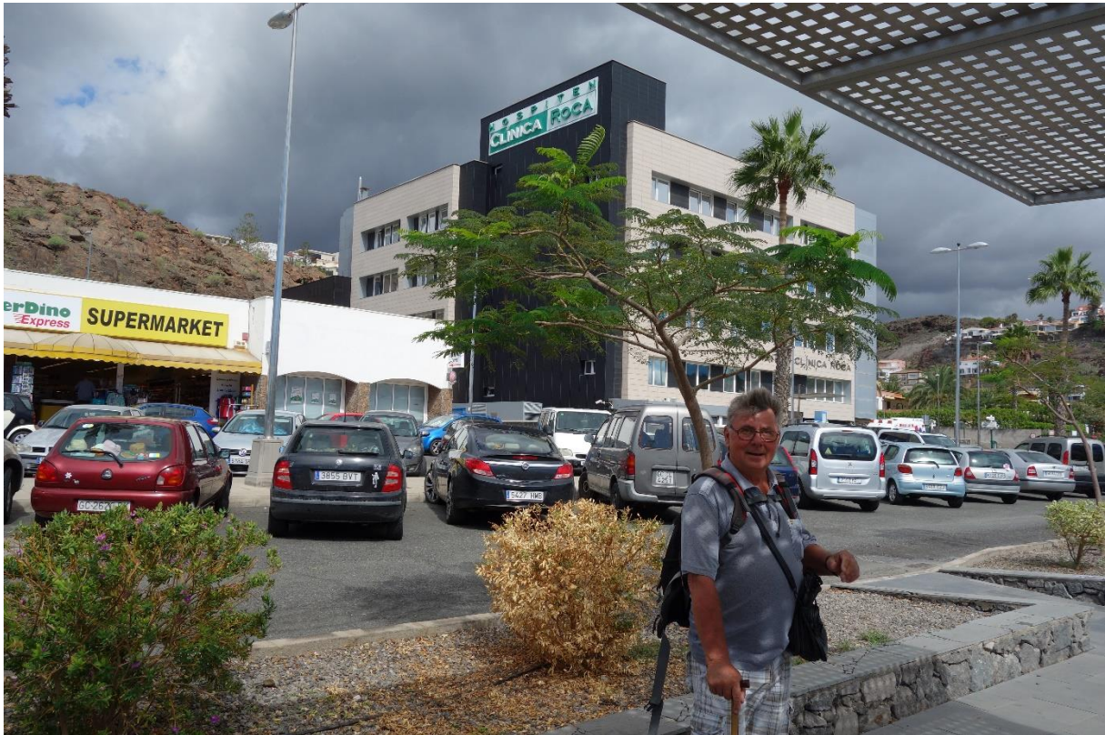
Den siste dagen med injeksjon på Clinica Roca.