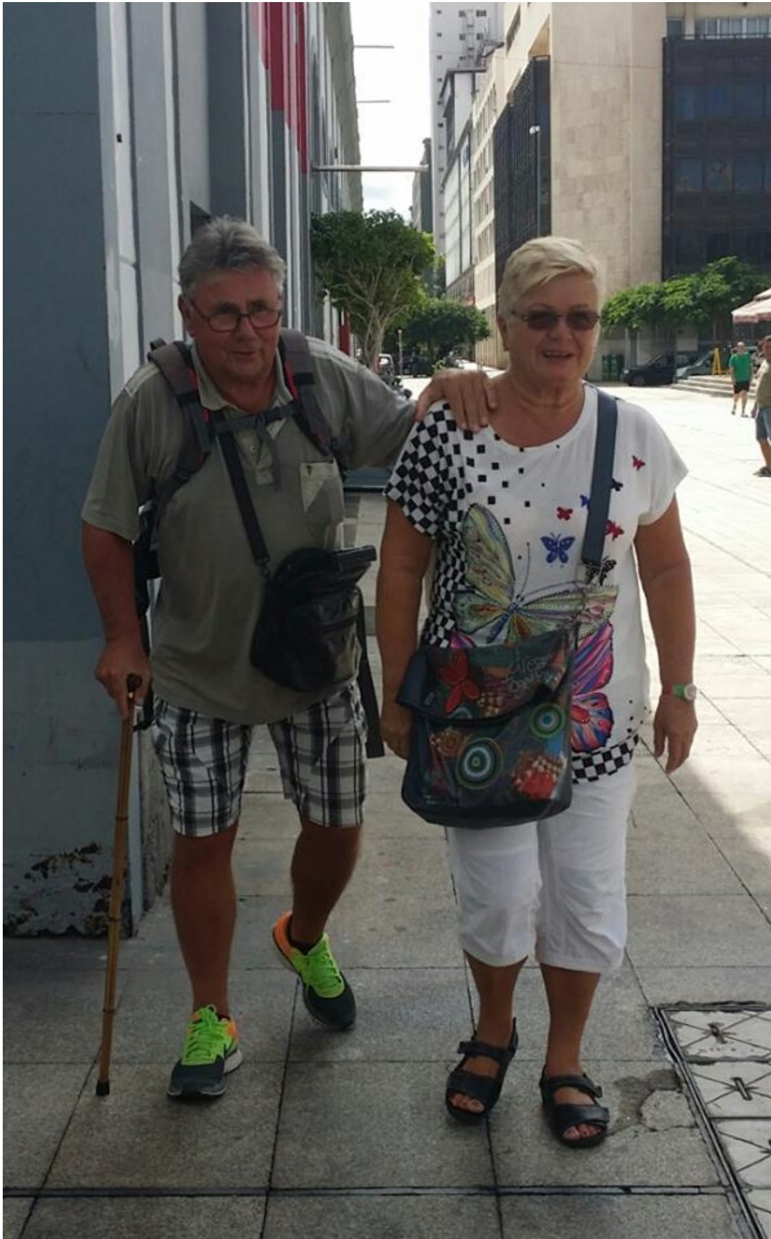
Disse to bildene av mannen med stokk, er fotografert av Gro. Jeg husker ikke hvem han var eller er.