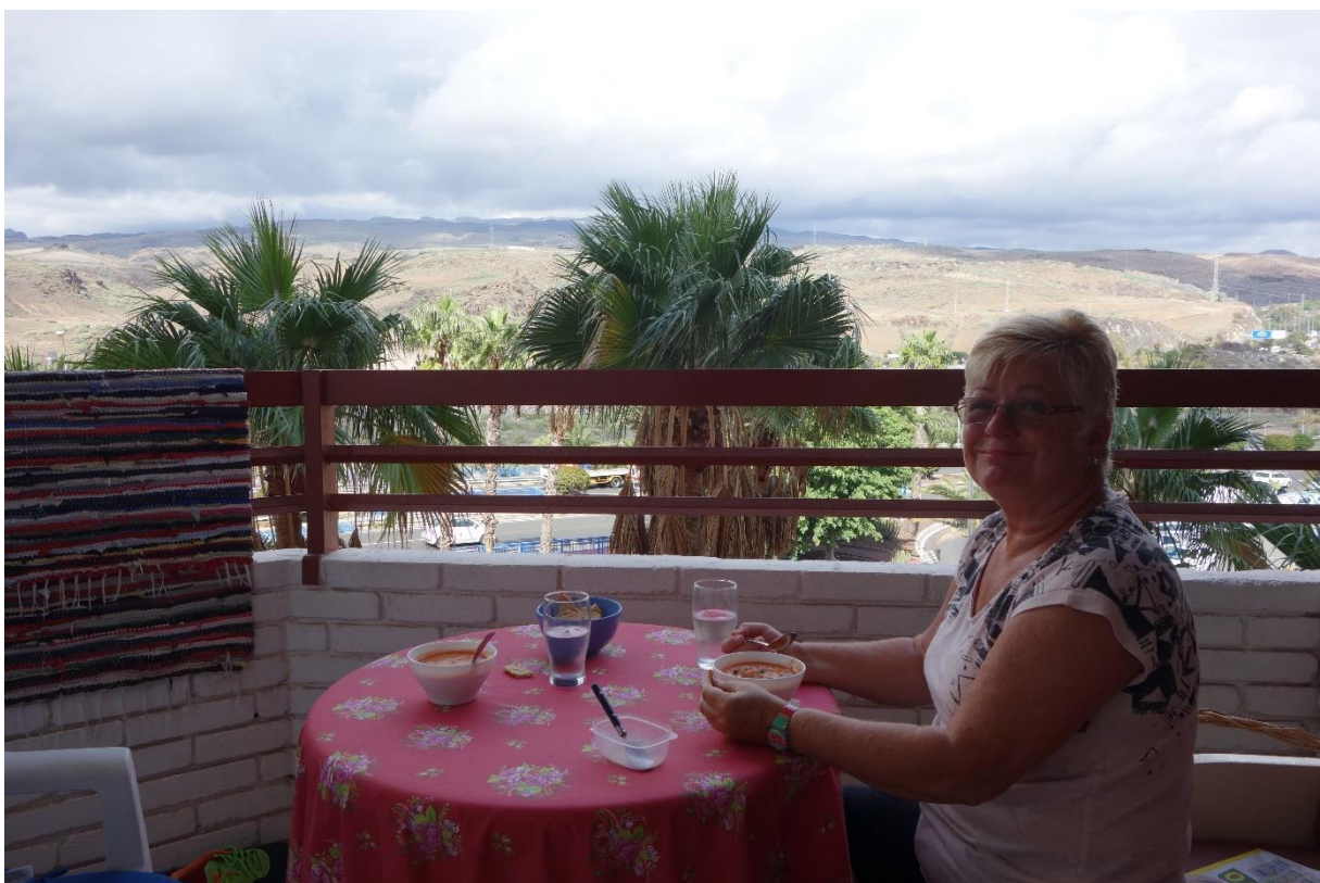
Gazpacho, kald tomatsuppe, på balkongen mot fjellet.