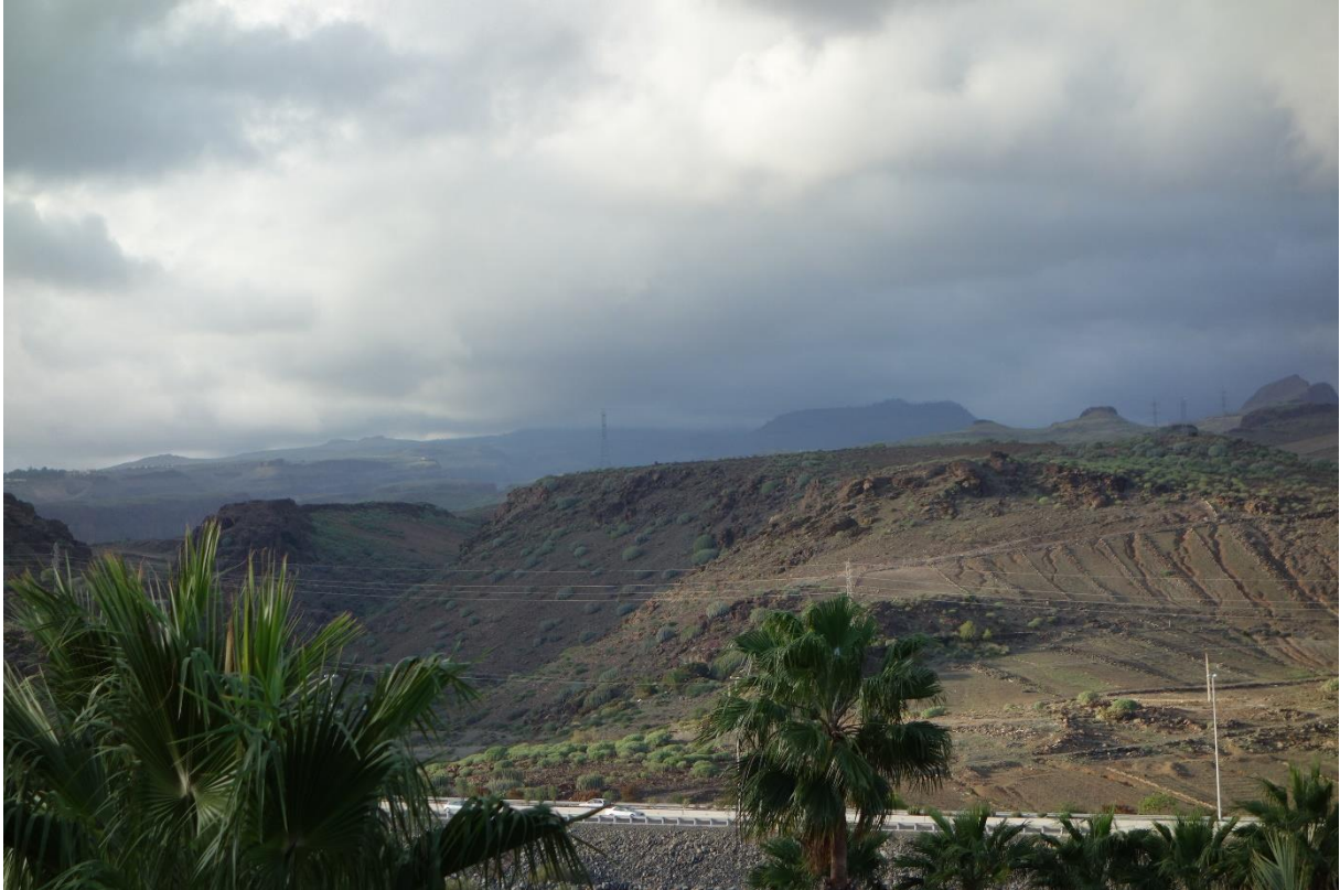
Så kommer de mørke skyene fra fjellet.