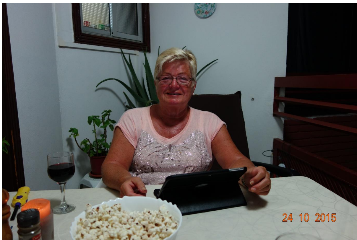
. . . og mens det drysser lett regn som gjør alt rundt oss vått, sitter vi og nyter popkorn på balkongen.